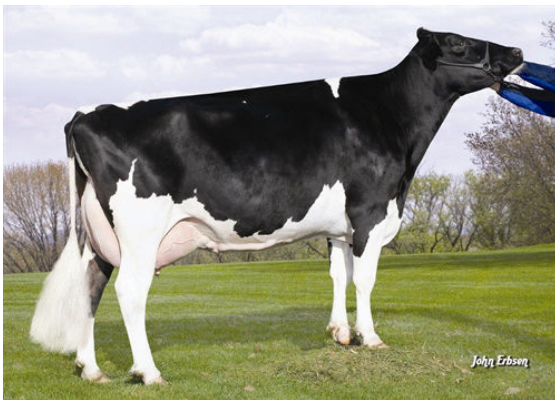
MORNINGVIEW SHTL LUCY FOURTH DAM